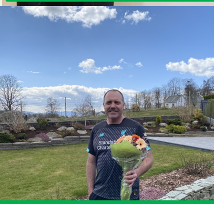
MÅNEDENS BLOMST PRESENTERT AV BLOMSTERSTUA STRAND