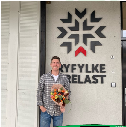
MÅNEDENS BLOMST PRESENTERT AV BLOMSTERSTUA STRAND