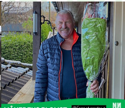
MÅNEDENS BLOMST PRESENTERT AV BLOMSTERSTUA STRAND