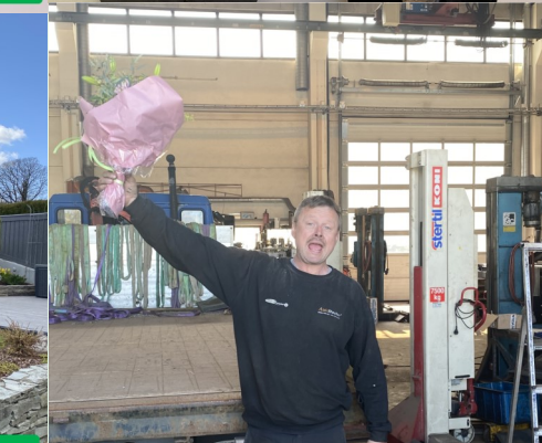
MÅNEDENS BLOMST PRESENTERT AV BLOMSTERSTUA STRAND