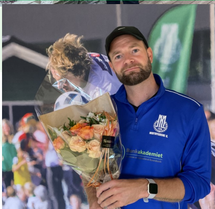
MÅNEDENS BLOMST PRESENTERT AV BLOMSTERSTUA STRAND