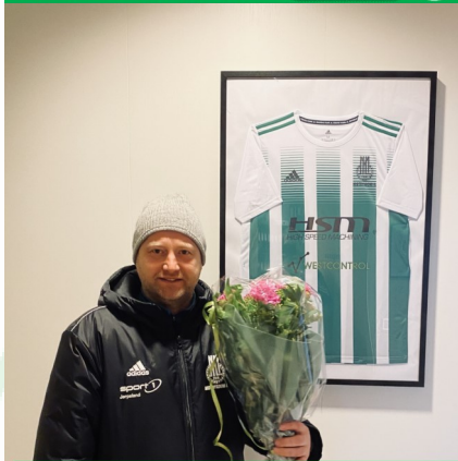
MÅNEDENS BLOMST PRESENTERT AV BLOMSTERSTUA STRAND