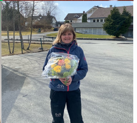
MÅNEDENS BLOMST PRESENTERT AV BLOMSTERSTUA STRAND