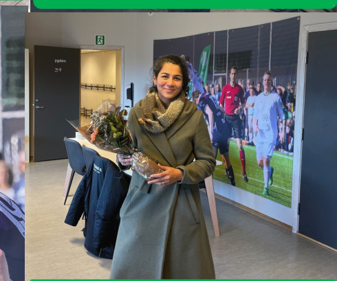
MÅNEDENS BLOMST PRESENTERT AV BLOMSTERSTUA STRAND