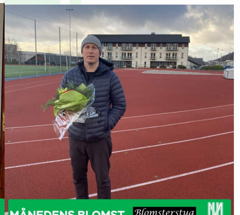
MÅNEDENS BLOMST PRESENTERT AV BLOMSTERSTUA STRAND