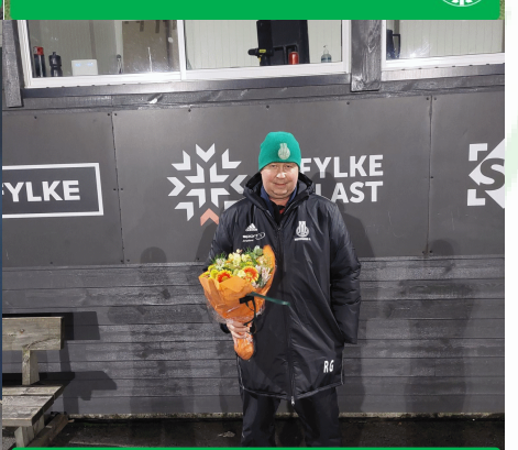
MÅNEDENS BLOMST PRESENTERT AV BLOMSTERSTUA STRAND