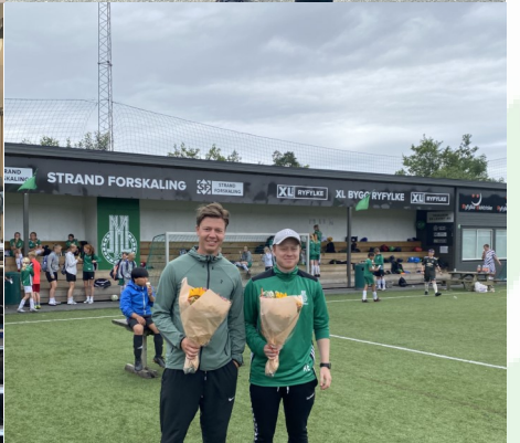
MÅNEDENS BLOMST PRESENTERT AV BLOMSTERSTUA STRAND