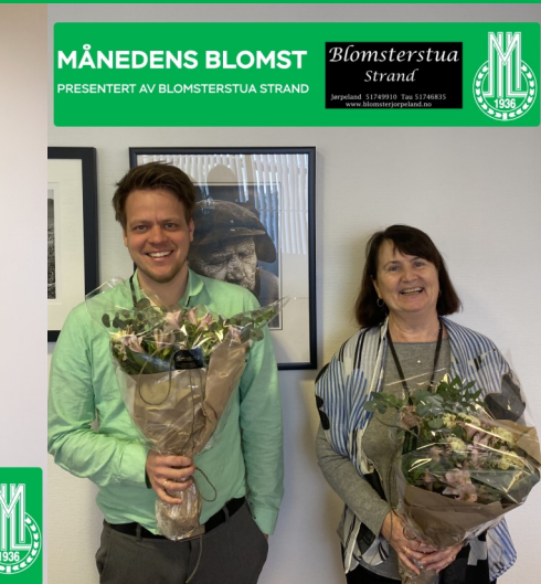
MÅNEDENS BLOMST PRESENTERT AV BLOMSTERSTUA STRAND